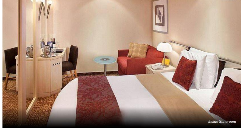
ห้องพักไม่มีหน้าต่าง Inside Room