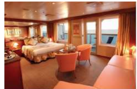
Grand Suite (GS) (for 2 to 3 people)

48.3 sq m (519.89 sq ft) 1 double bed or 2 single beds 1 sofa bed Dressing room Bathroom with shower & Jacuzzi