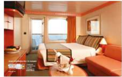
Balcony Classic (BC) Balcony Premium (BP) (for 2 to 4 people)

17.7 sq m (190.52 sq ft) 1 double bed or 2 single beds 1 foldaway bed Window (non open)