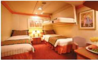
Inside Classic (IC) Inside Premium (IP) (for 2 to 4 people)