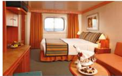
Oceanview Classic (EC) Oceanview Premium (EP) (for 2 to 4 people)

13.9 sq m (149.6 sq ft) 1 double bed or 2 single beds 2 foldaway beds