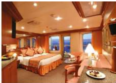
Suite with Oceanview Balcony (S) (for 2 to 3 people)

20.4 sq m (219.58 sq ft) 1 double bed or 2 single beds 1 foldaway bed 1 sofa bed