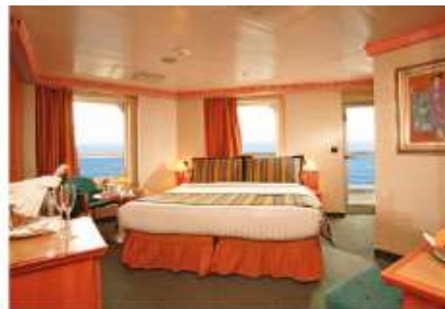
Mini Suite with Oceanview Balcony (MS) (for 2 to 3 people)

31.3 sq m (336.91 sq ft) 1 double bed or 2 single beds 1 sofa bed Bathroom with shower & Jacuzzi