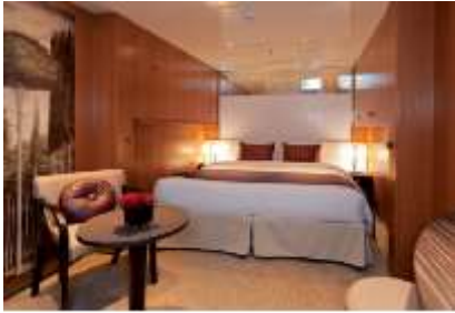
ห้องพักแบบไม่มีหน้าต่าง ขนาด 16.6 ตารางเมตร