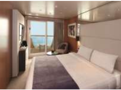
ห้องพักแบบมีระเบียง ขนาด 24.2 ตารางเมตร