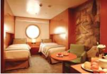
ห้องพักแบบมีหน้าต่าง ขนาด 16.6 ตารางเมตร