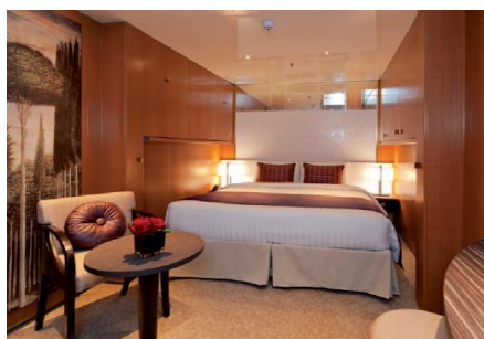
Inside : 16.60M 2 (for 2 to 4 people)