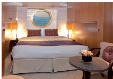
Ocean View : 16.60M 2 (for 2 to 4 people)