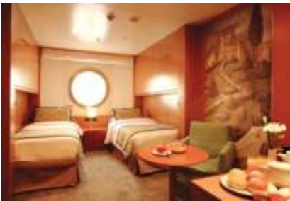
ห้องพักแบบมีหน้าต่าง ขนาด 16.6 ตารางเมตร