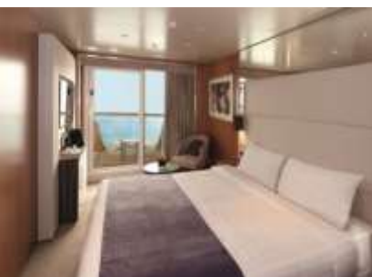
ห้องพักแบบมีระเบียง ขนาด 24.2 ตารางเมตร