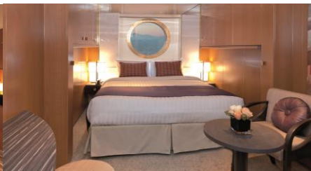
ห้องพักมีหน้าต่าง