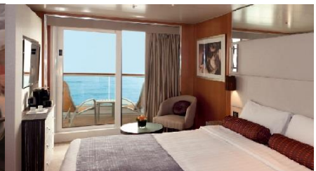
ห้องพักมีระเบียง