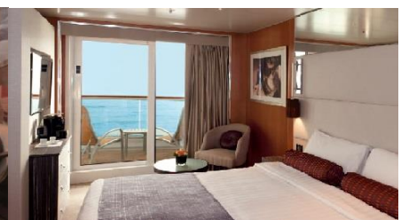
ห้องพักมีระเบียง