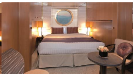
ห้องพักมีหน้าต่าง