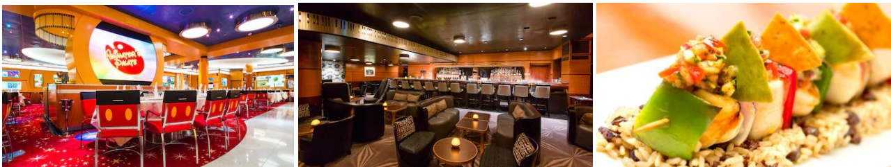
ห้องอาหารสุดพิเศษ