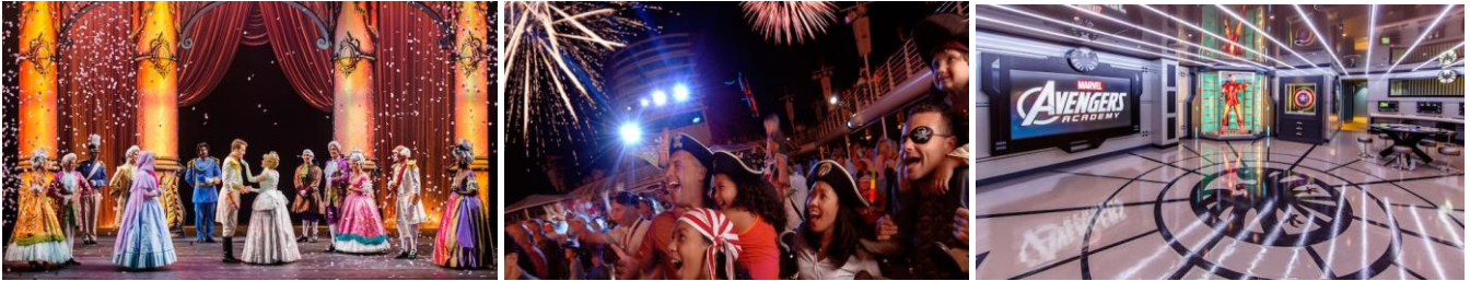
อินเทอร์เทนเมนท์