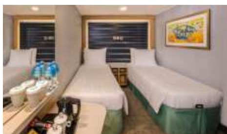
ห้องพักไม่มีหน้าต่าง