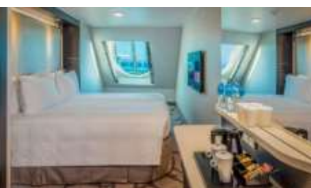
ห้องพักมีหน้าต่าง