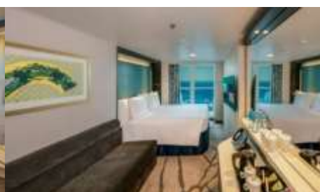
ห้องพักมีระเบียง