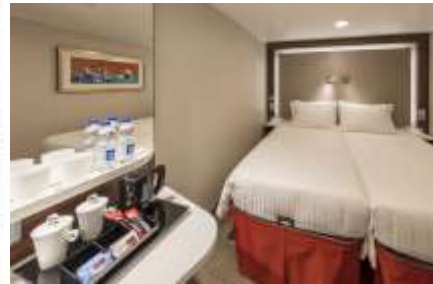
ห้องไม่มีหน้าต่าง INTERIOR STATEROOM