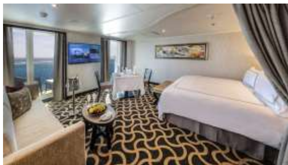
PALACE SUITE / DELUXE ห้องแบบสวีท