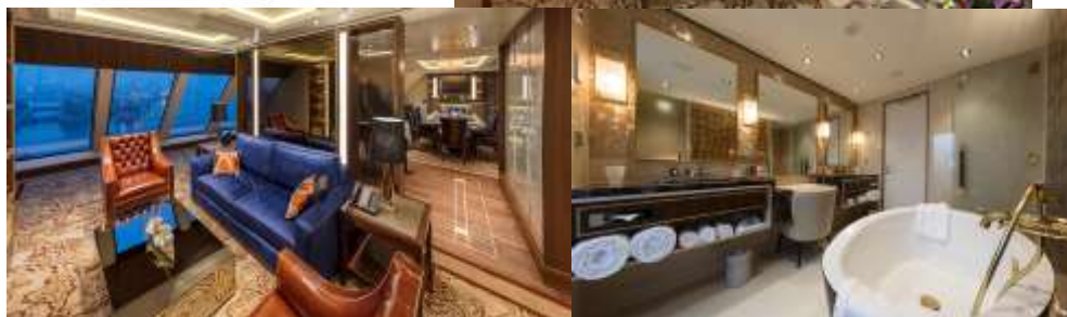
PALACE VILLA ห้องสวีทวิลล่า

เพื่อประโยชน์ของผู้เดินทาง โปรดศึกษาเงื่อนไขการจองทัวร์ และการยกเลิกทัวร์ ที่ระบุในรายการทั้งหมด หลังจากท่านทำการจองทัวร์แล้ว ทางบริษัทฯจะถือว่าท่านเข้าใจ และพร้อมปฏิบัติตามเงื่อนไขดังกล่าว