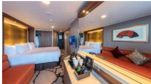
BALCONY DELUXE STATEROOM ห้องระเบียงดีลักซ์