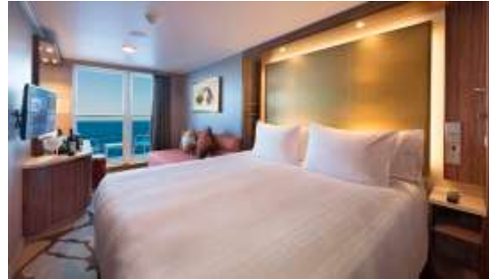
BALCONY STATEROOM ห้องมีระเบียง