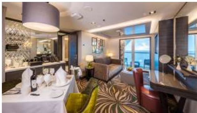
PALACE PENTHOUSE ห้องสวีทเพ้นเฮ้าท์