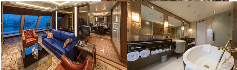
PALACE VILLA ห้องสวีทวิลล่า

อัตราค่าบริการ ต่อท่าน (งดแถมกระเป๋า) วันที่ 1-4 ธ.ค. 62