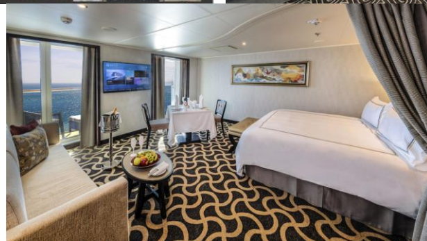
PALACE SUITE / DELUXE ห้องแบบสวีท