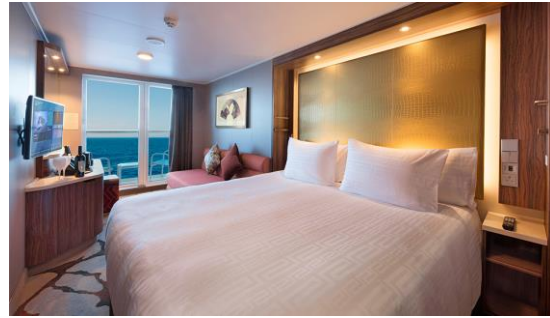
BALCONY STATEROOM ห้องมีระเบียง