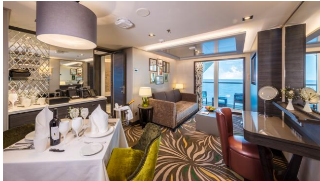
PALACE PENTHOUSE ห้องสวีทเพ้นเฮาท์