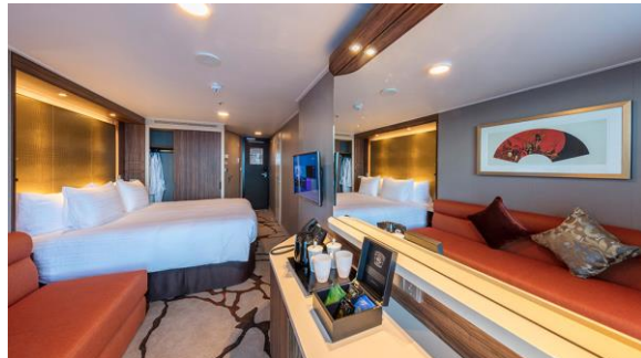
BALCONY DELUXE STATEROOM ห้องระเบียงดีลักซ์