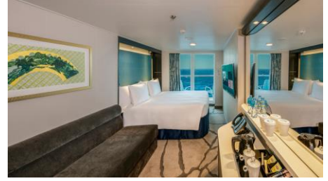
ห้องพักแบบมีระเบียง