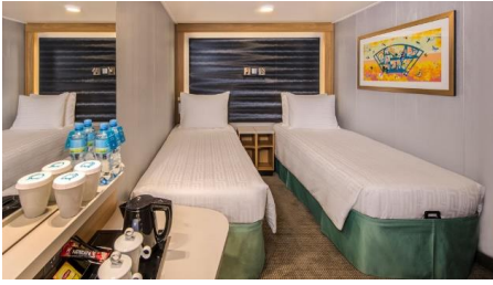
ห้องพักแบบไม่มีหน้าต่าง