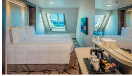
ห้องพักแบบมีหน้าต่าง