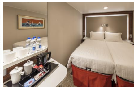
ห้องไม่มีหน้าต่าง INTERIOR STATEROOM