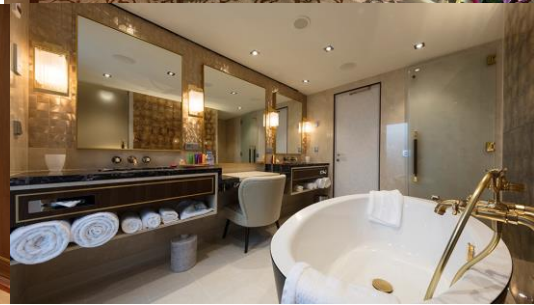
PALACE VILLA ห้องสวีทวิลล่า