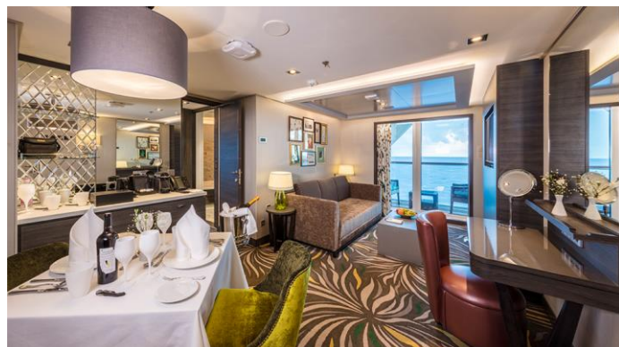
PALACE PENTHOUSE ห้องสวีทเพ้นเฮาท์