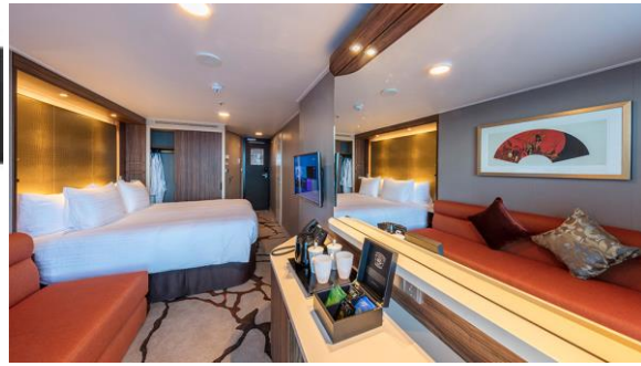
BALCONY DELUXE STATEROOM ห้องระเบียงดีลักซ์