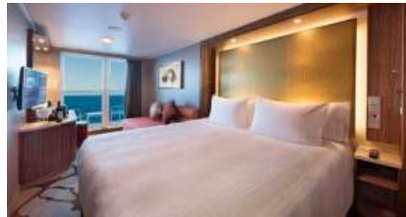
ห้องพักแบบมีระเบียง Balcony