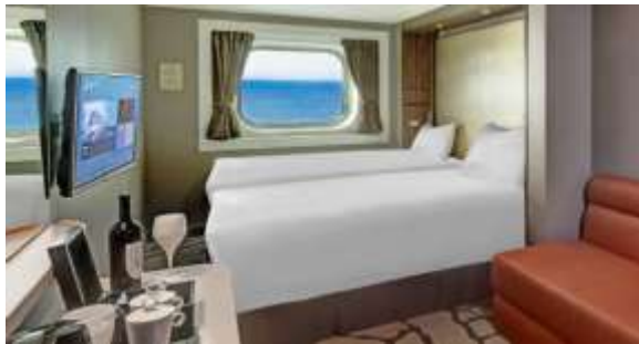
ห้องพักแบบมีหน้าต่าง Oceanview