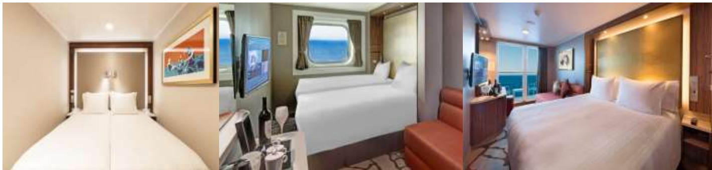
ห้องไม่มีหน้าต่าง INSIDE