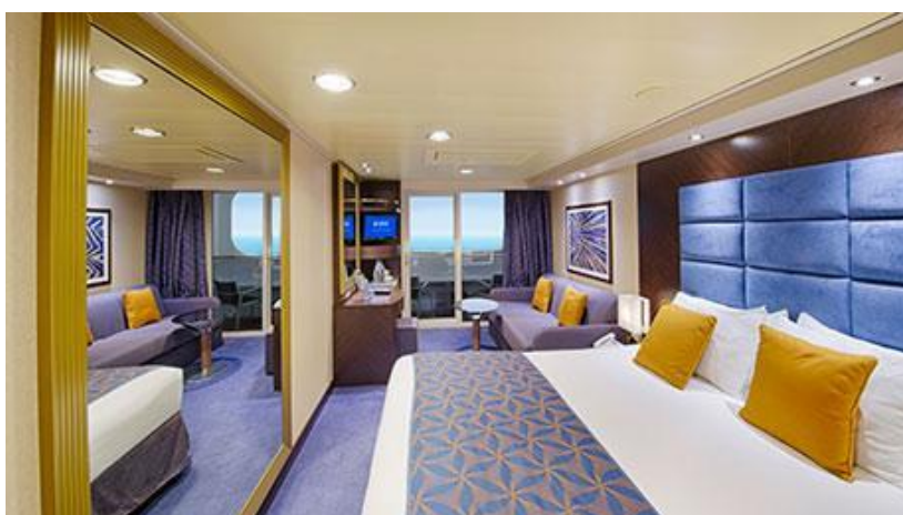
ห้องมีระเบียง Balcony