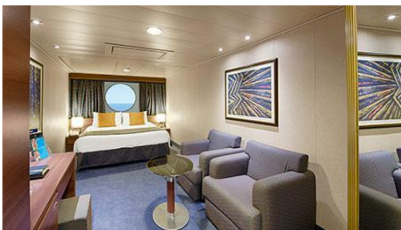
ห้องมีหน้าต่าง Ocean View