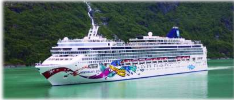
เดินทางพร้อมเจ้าหน้าที่ อำนวยความสะดวก

เส้นทาง ซูเวิร์ด - ล่องเรือชม Hubbard Glacier - ไอซ์ซี สเตรท พอยท์ - จูโน้ - Endicott Arm & Dawes Glacier - สแกกเวย์ - เคทชิเคน - ล่องเรือชม Inside Passage - แวนคูเวอร์