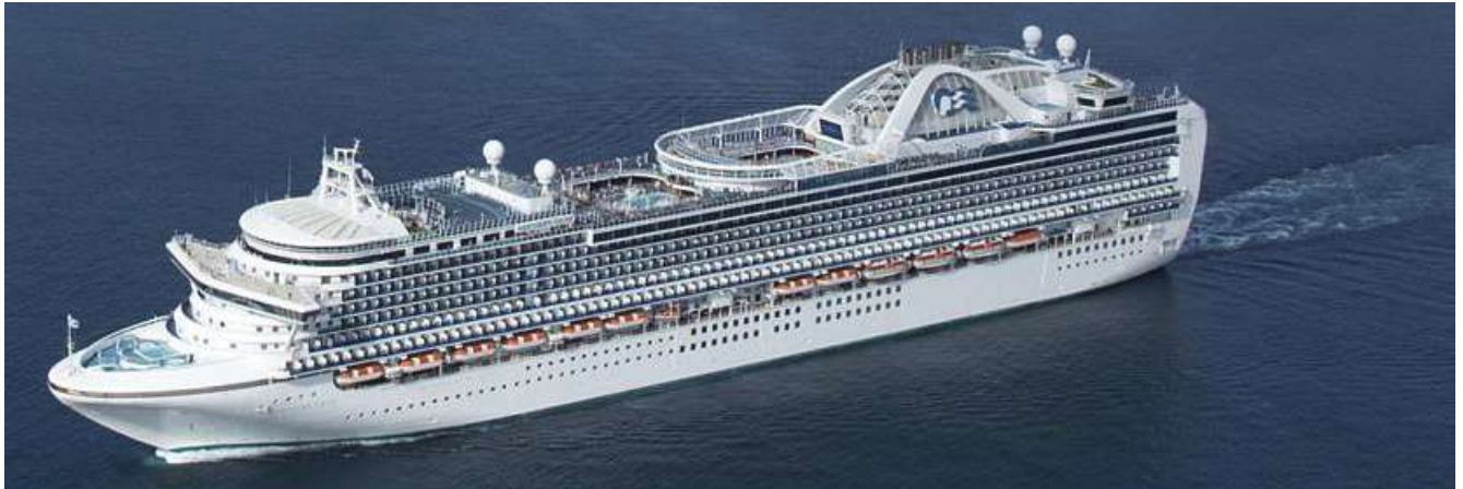
ข้อมูลเรือ Ruby Princess