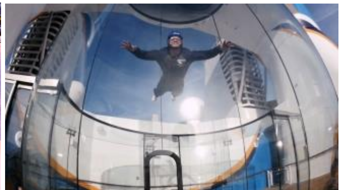
Ripcord by iFLY