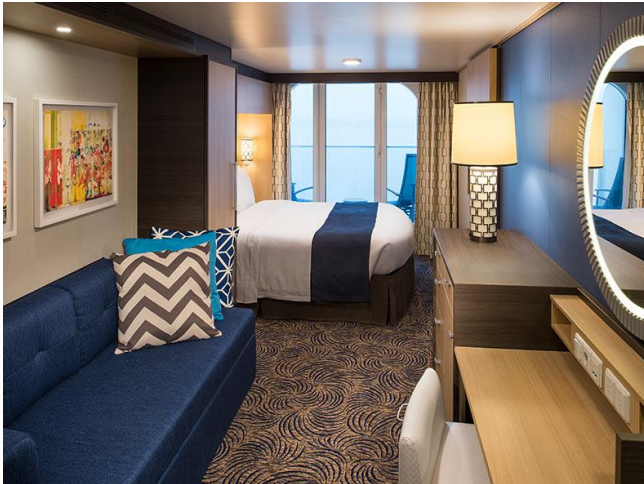
ห้องพักรมึระเบียง