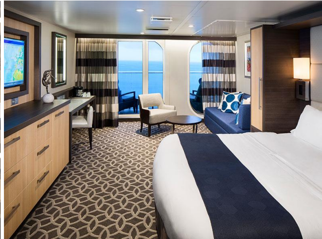
ห้องพักรมึวิท (การ์ันตีไม่ทราบเบอร์ห้อง)