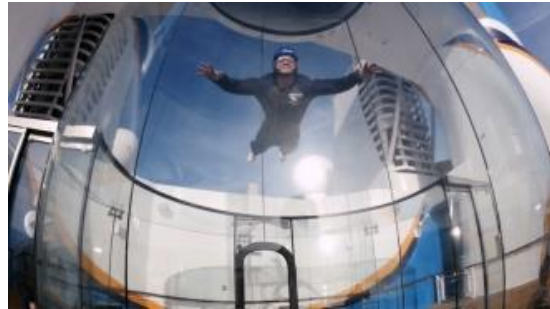
Ripcord by iFLY