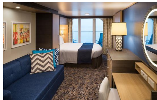
ห้องพักมีระเบียง