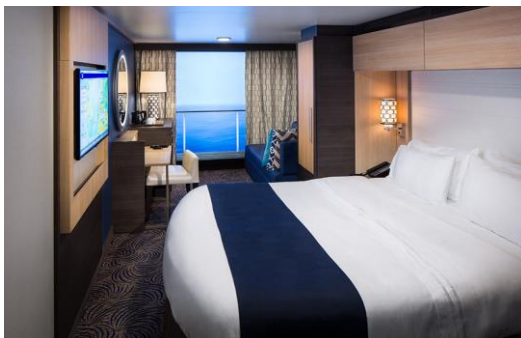
ห้องไม่มีหน้าต่าง(การันตี)

เราสามารถจองตัวเครื่องบินและที่พักเพิ่มเติมให้ท่าน รับประกันราคาถูก กรุณาติดต่อเจ้าหน้าที่ ประเภทห้องพักบนเรือ QUANTUM OF THE SEA