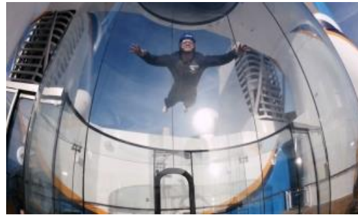
Ripcord by iFLY