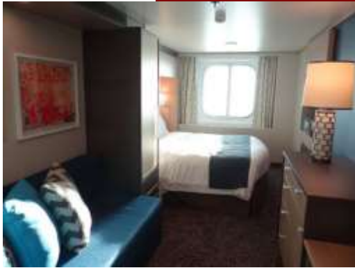
ห้องมีหน้าต่าง Ocean view stateroom