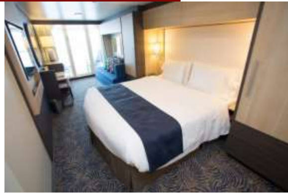
ห้องมีระเบียง Balcony stateroom

อัตราค่าบริการ ต่อท่าน งดแถมกระเป๋า วันที่ 11-16 ม.ค. 63