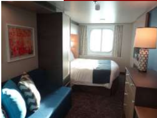
Ocean view stateroom