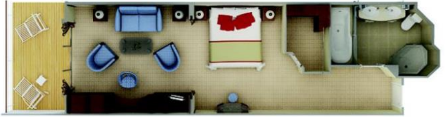
Veranda Suite One bedroom: 32 m 2