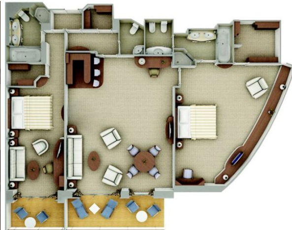
Royal Suite One bedroom: 90-94 m 2 including veranda Two bedroom: 122-126 m 2