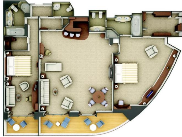
Grand Suite One bedroom: 87-101 m 2 including veranda Two bedroom: 119-133 m 2