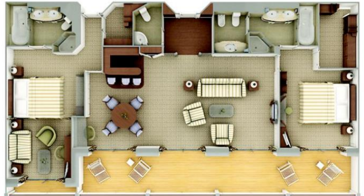
Owner's Suite One bedroom: 85 m 2 including veranda Two bedroom: 117 m 2