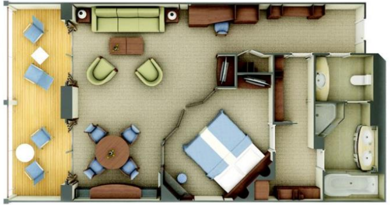
Silver Suite One bedroom: 61-65 m 2