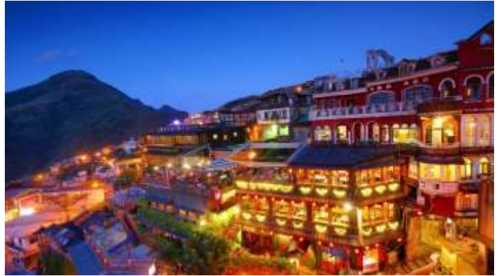
21.00 น. เดินทางออกจากท่าเรือจีหลง เมืองไทเป ประเทศไต้หวัน