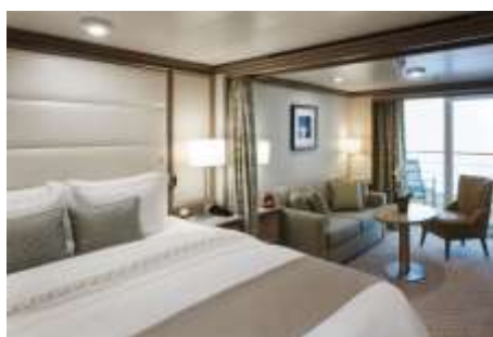
Classic Veranda Suite