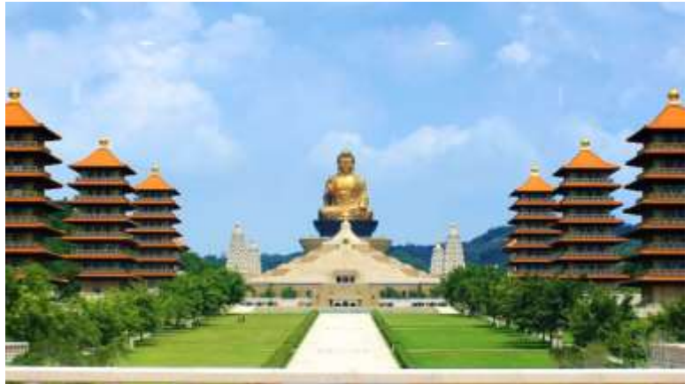
20.00 น. เดินทางออกจากท่าเรือเมืองเกาสง ประเทศไต้หวัน