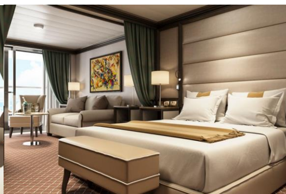
Superior Veranda Suite 36 m 2