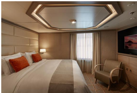
Royal Suite 105 m 2 / 142 m 2