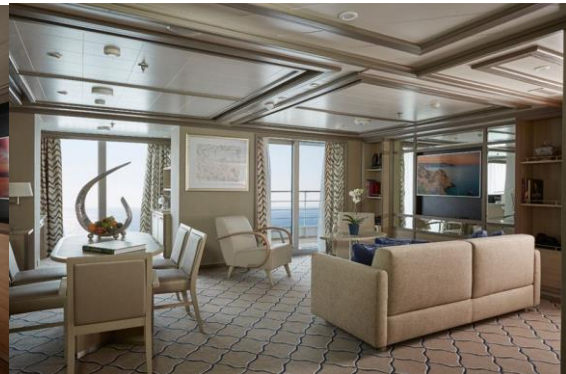
Owner's Suite 88 - 98 m 2 / 119 - 129 m 2