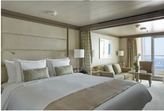
Deluxe Veranda Suite 36 m 2