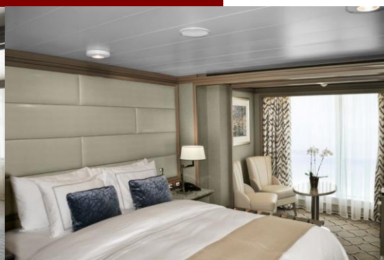
Panorama Suite 31 m 2