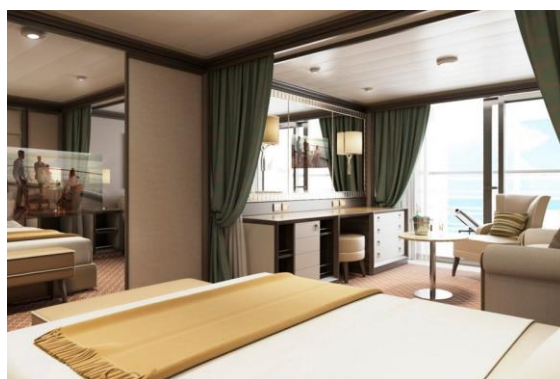
Classic Veranda Suite 36 m 2