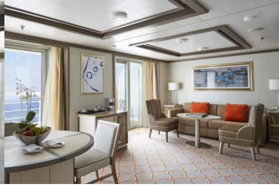
Silver Suite 73 m 2