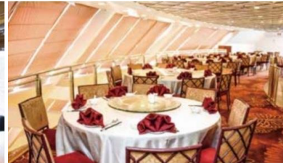
Genting Palace Chinese cuisine