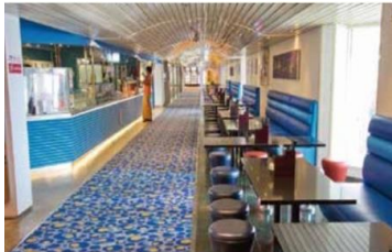
Blue Lagoon Asian snacks, 24-hour