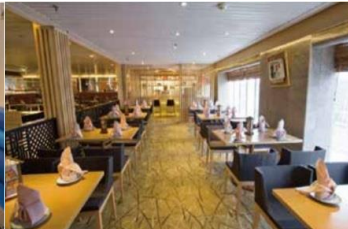
Sushi Bar Japanese cuisine