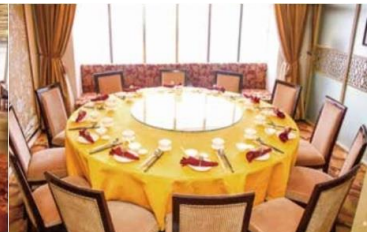
Iaipan Chinese cuisine

หลังอาหารเชิญท่านชมการแสดงสุดอลังการ ณ ห้อง Galaxy of the Stars บริเวณชั้น 8