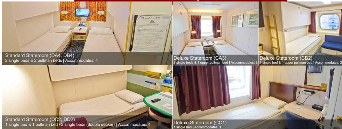
ห้องพักแบบไม่มีหน้าต่าง Inside