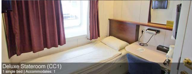
ห้องพักมีหน้าต่าง Ocean view