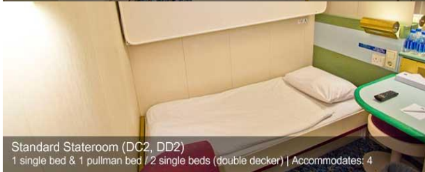
ห้องพักไม่มีหน้าต่าง Inside