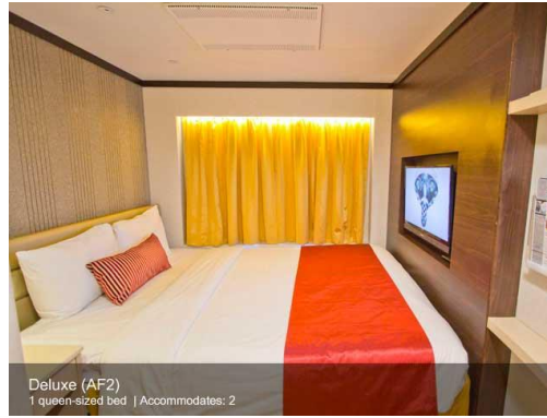
ห้องพักรีสuite