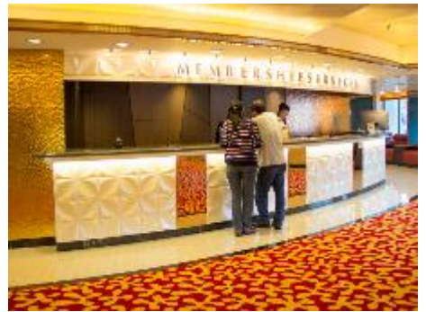
Membership Services Counter