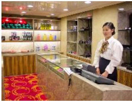
Port's O Call