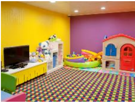
Child Care Centre