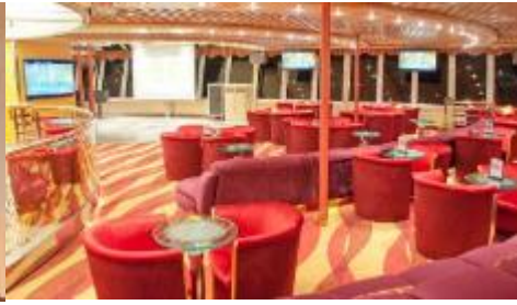
Karaoke Lounge / KTV