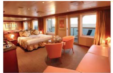
Grand Suite (GS) (for 2 to 3 people)

48.3 sq m (519.89 sq ft) 1 double bed or 2 single beds 1 sofa bed Dressing room Bathroom with shower & Jacuzzi