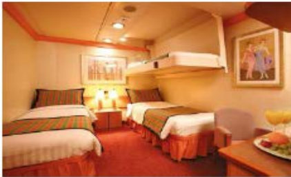
Inside Classic (IC) Inside Premium (IP) (for 2 to 4 people)