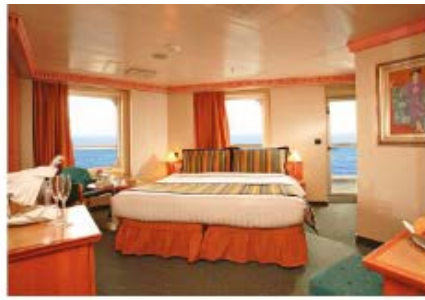
Mini Suite with Oceanview Balcony (MS) (for 2 to 3 people)

31.3 sq m (336.91 sq ft) 1 double bed or 2 single beds 1 sofa bed Bathroom with shower & Jacuzzi