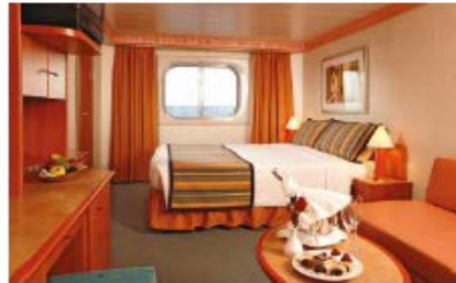
Oceanview Classic (EC) Oceanview Premium (EP) (for 2 to 4 people)

13.9 sq m (149.6 sq ft) 1 double bed or 2 single beds 2 foldaway beds