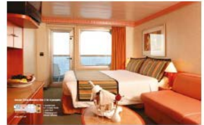
Balcony Classic (BC) Balcony Premium (BP) (for 2 to 4 people)

17.7 sq m (190.52 sq ft) 1 double bed or 2 single beds 1 foldaway bed Window (non open)