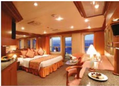
Suite with Oceanview Balcony (S) (for 2 to 3 people)

20.4 sq m (219.58 sq ft) 1 double bed or 2 single beds 1 foldaway bed 1 sofa bed