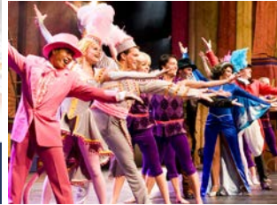
โชว์ และการแสดง