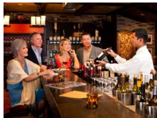
บาร์ - ไนต์คลับ