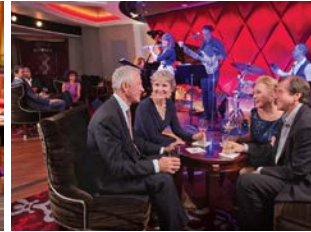
การแสดงออร์เคสตรา