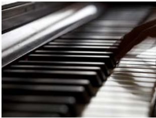
ดนตรี - โหรวเปียโน