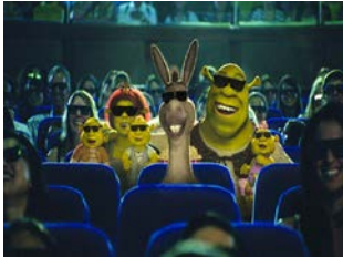
ภาพยนตร์ 3D