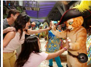
ตัวละครจากDreamWorks