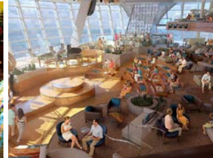
ห้องรับรองขนาดใหญ่