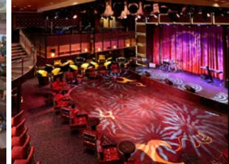
ห้องจัดการแสดง