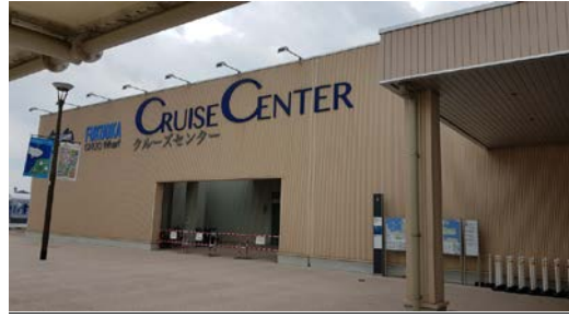
ท่าเรือ Hakata (Fukuoka)