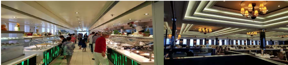
หรือ กาล่าดินเนอร์ได้ที่ Botticelli Restaurant ชั้น 8

รับประทานอาหารค่ำในห้องอาหารบนเรือสำราญที่ห้องอาหาร International Buffet – Giardino Restaurant ชั้น 10