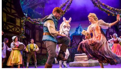
โชว์ The Musical