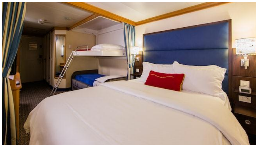
Standard Inside Stateroom (184 sq. ft.)

จองตั๋วเครื่องบิน รับประกันราคาถูก คลิก etravelway.com/airticket