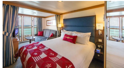
Deluxe Oceanview Stateroom with Verandah (268 sq. ft.)