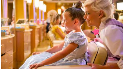
ห้องเสริมสวย ชาลอน