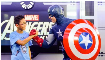
พบกับเหล่าวีรบุรุษ และ การแสดง