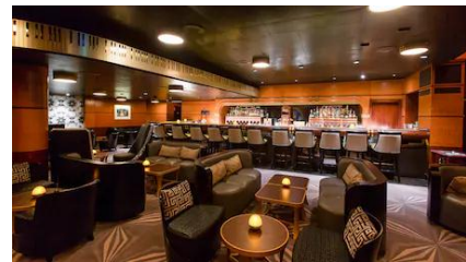
ห้องไนท์คลับ