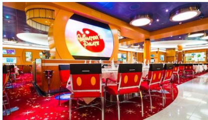
ห้องอาหาร พร้อม เหล่าตัวละครจาก ดิสนีย์