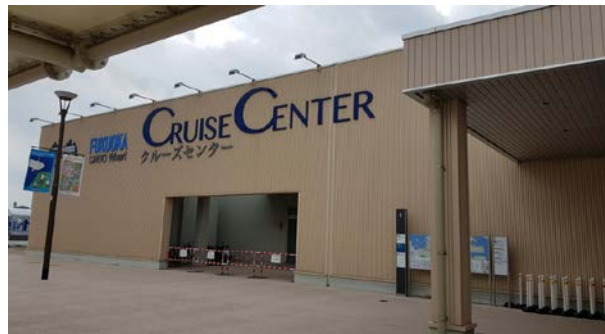
ท่าเรือ Hakata (Fukuoka)