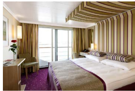
ห้องพักแบบ Outside มีระเบียง โซน C ชั้น 2