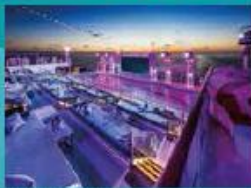
Zouk Beach Club Outdoor party/entertainment venue.