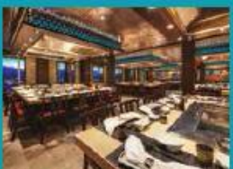
Umi Uma Teppanyaki Grand tables for grilling action.