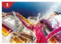
Waterslide Park Get drenched in fun on one of our six different waterslides.