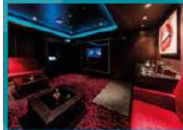
Karaoke Five private karaoke rooms.