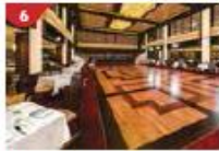
Dream Dining Room Savour a wide variety of Asian and international cuisine.