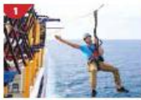
Ropes Course & Zipline Feel the thrill of gliding above the ocean on a 35-metre zipline.