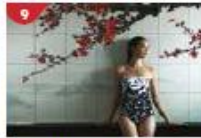
Crystal Life™ Spa Rejuvenate mind, body and soul with our holistic Western and Asian spa experience.