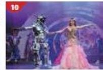
Zodiac Theatre Enjoy live production shows from the acclaimed award-winning entertainment team.