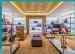
The Dream Boutiques Splurge on duty-free shopping.