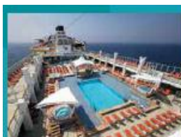
Main Pool Deck Stay cool at the swimming pool.