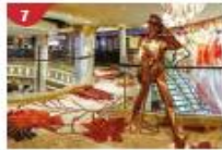
Johnnie Walker House™ Immerse yourself in the intricate world of premium Scotch whisky.