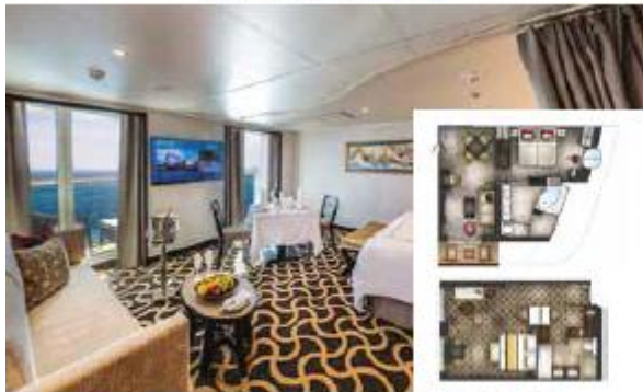
PALACE DELUXE SUITE

From 41 sq.m | Max Occupancy 4 | Deck 9/10/11/12/13/15 1 Queen-size Bed - 1 Double Sofa Bed