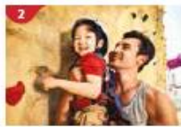
Rock Climbing Wall Challenge yourself on our mountainous rock climbing wall.