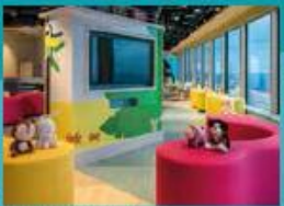
Little Pandas Club Kids club with supervised activities.