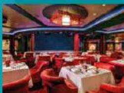
Silk Road Chinese Restaurant Chinese fine dining in old glamour setting.