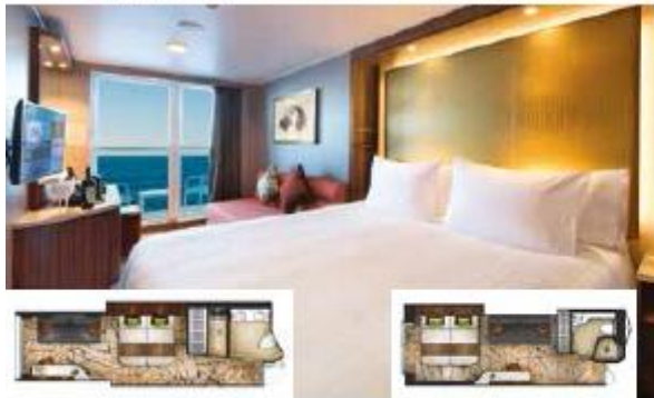
BALCONY DELUXE STATEROOM

From 22 sq.m Max Occupancy 3-4 Deck 8/9/10/11/12/13/15 1 Queen-size Bed + 1 Single Sofa Bed/ 1 Double Sofa Bed/ 1 Single Sofa Bed - 1 Ceiling Pullman Bed