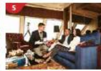
The Palace Indulge in European-style butler service and exclusive facilities.