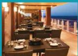
Hot Pot Outdoor hot pot with scenic ocean views.