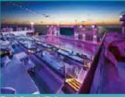
Zouk Beach Club Outdoor party/entertainment venue.