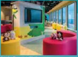
Little Pandas Club Kids club with supervised activities.