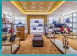
The Dream Boutiques Splurge on duty-free shopping.