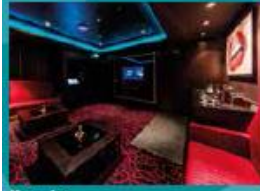
Karaoke Five private karaoke rooms.