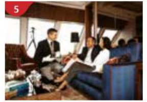
5 The Palace Indulge in European-style butler service and exclusive facilities.