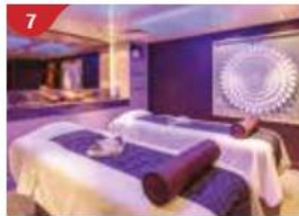
7 Crystal Life™ Rejuvenate mind, body and soul with our holistic Western and Asian spa experience.