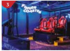
3 Esc EXPERIENCE LAB Explore different worlds with an incredible selection of VR games for the whole family.