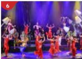
6 Zodiac Theatre Enjoy live production shows from the acclaimed award-winning entertainment team.