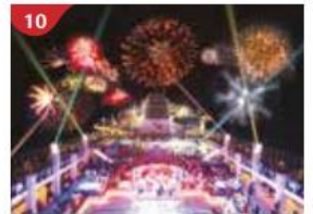
10 Dream Night Feel the electricity in the air at our live fireworks and laser show at sea.