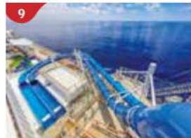
9 Waterslide Park Get drenched in fun on one of our six different waterslides.