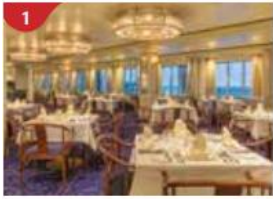
1 Prime Steakhouse Savour premium cuts from around the world.