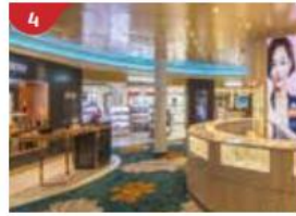
4 The Dream Boutiques Splurge on international luxury brands with our duty-free shopping.