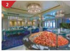
2 Seafood Grill Relish the freshest seafood in the region in Asian or Western style.