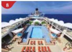
8 Main Pool Deck Stay cool at the swimming pool and Kids Water Park.