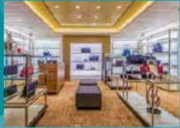
The Dream Boutiques Spillage on duty-free shopping