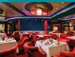
Silk Road Chinese Restaurant Chinese fine dining in old glamour setting