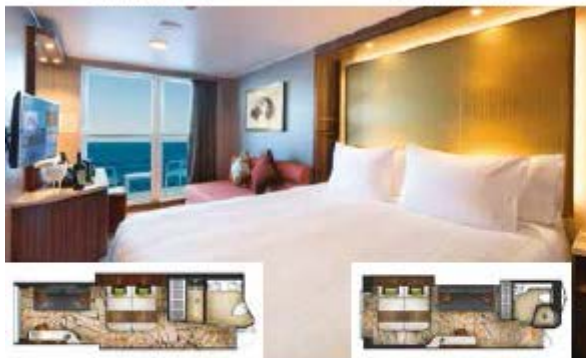
BALCONY DELUXE STATEROOM

From 22 sq.m Max Occupancy 3-4 Deck 8/9/10/11/12/13/15 1 Queen-size Bed - 1 Single Sofa Bed/ 1 Double Sofa Bed/ 1 Single Sofa Bed - 1 Ceiling Pullman Bed