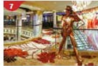
Johnnie Walker House™ Immerse yourself in the intricate world of premium Scotch whisky.