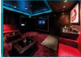
Karaoke Five private karaoke rooms