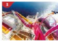
Waterslide Park Get drenched in fun on one of our six different waterslides.