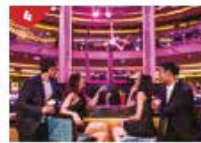
Bar 360 Catch live music and aerial acrobatic performances with a glass of champagne.