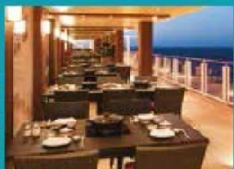
Hot Pot Outdoor hot pot with scenic ocean views