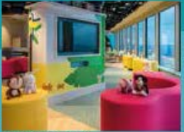
Little Pandas Club Kids club with supervised activities