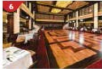
Dream Dining Room Savour a wide variety of Asian and international cuisine.