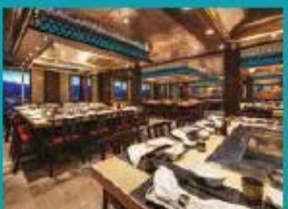
Umi Uma Teppanyaki Grand tables for grilling action