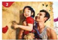
Rock Climbing Wall Challenge yourself on our mountainous rock climbing wall.