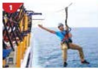
Ropes Course & Zipline Feel the thrill of gliding above the ocean on a 35-metre zipline.