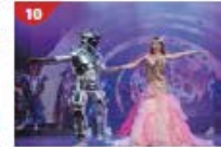
Zodiac Theatre Enjoy live production shows from the acclaimed award-winning entertainment team.