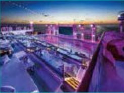
Zouk Beach Club Outdoor party/entertainment venue