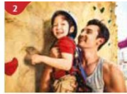
Rock Climbing Wall Challenge yourself on our mountainous rock climbing wall.