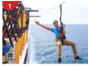
Ropes Course & Zipline Feel the thrill of gliding above the ocean on a 35-metre zipline.