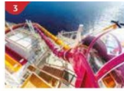
Waterslide Park Get drenched in fun on one of our six different waterslides.