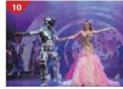
Zodiac Theatre Enjoy live production shows from the acclaimed award-winning entertainment team.