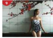
Crystal Life™ Spa Rejuvenate mind, body and soul with our holistic Western and Asian spa experience.