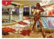
Johnnie Walker House™ Immerse yourself in the intricate world of premium Scotch whisky.