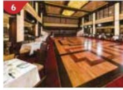
Dream Dining Room Savour a wide variety of Asian and international cuisine.