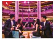
Bar 360 Catch live music and aerial acrobatic performances with a glass of champagne.