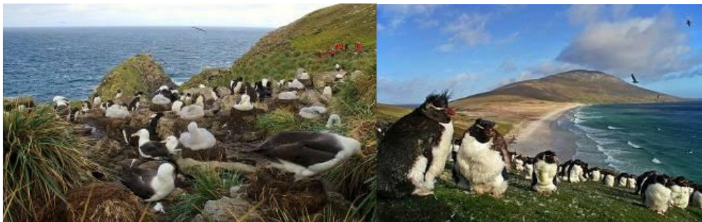
(อาหารเช้า, กลางวัน, เย็น, อาหารว่าง มีบริการบนเรือ ระหว่างการเดินทาง)

นำท่านสู่ เกาะแซนด์เตอร์ (Saunders Island) อันเป็นที่อยู่ของฝูง นกเพนกวินพันธุ์เกนตู (Gentoo Penguins) และ นกเพนกวินจักรพรรดิ (King Penguins) ซึ่งมีกว่าพันตัวในบริเวณนี้ อีสาระให้ท่านได้สัมผัสและถ่ายรูปกับฝูงนกเพนกวินนานาพันธุ์แบบใกล้ชิด