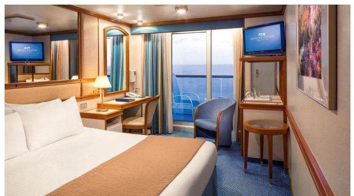
ห้องพักมีระเบียง