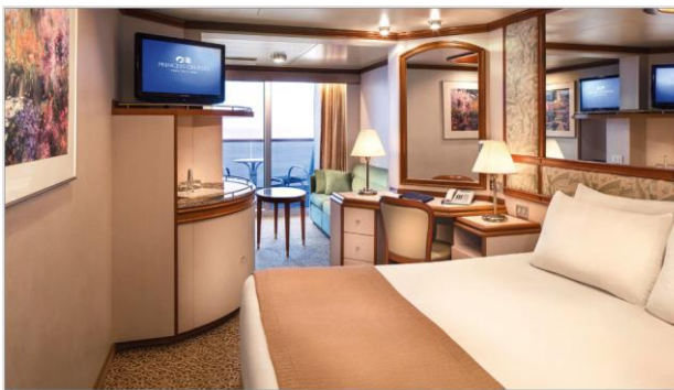
ห้องพัก Mini Suite