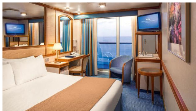
ห้องพักมีระเบียง