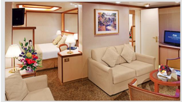
ห้องพัก Two Bedroom Family Suite