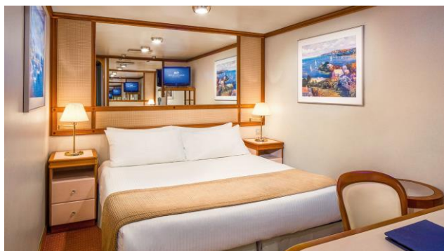
ห้องพักไม่มีหน้าต่าง