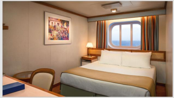
ห้องพักมีหน้าต่าง