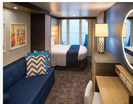
Ocean View Balcony