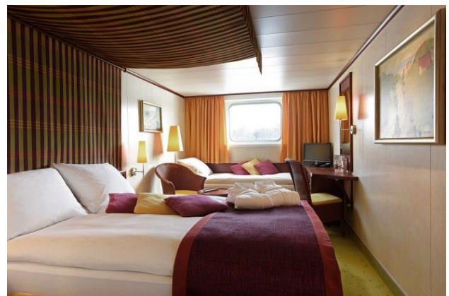
2 bed outside cabin with extra bed , deck 1 cabin A