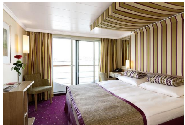
2 bed outside cabin with juliette balcony, deck 2 cabin C