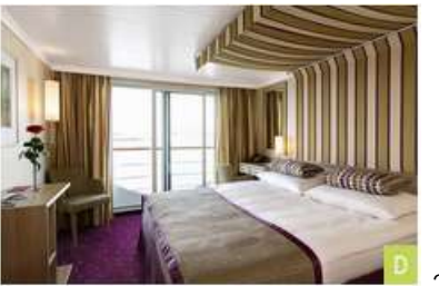
2-bed outside cabin with Juliette balcony, deck 3, D