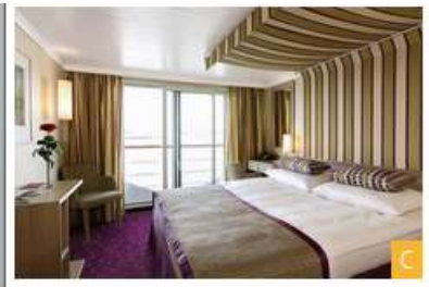
2-bed outside cabin with Juliette balcony, deck 2, C