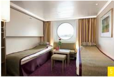
2-bed outside cabin with extra bed, deck 1, S