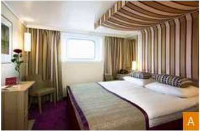
2-bed outside cabin, deck 1, A