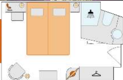
2-bed outside cabin, category A with extra bed 14.5 m 2 | Deck 1