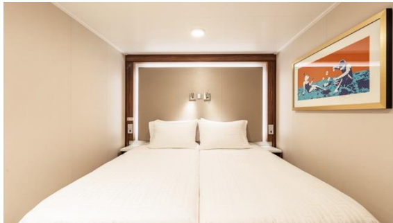
ห้องพักแบบไม่มีหน้าต่าง Inside