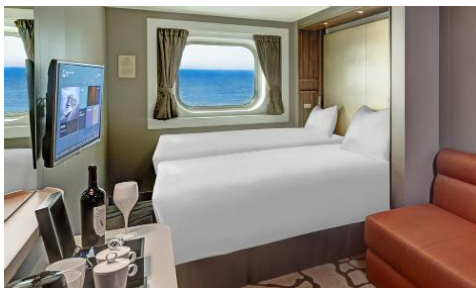
ห้องพักแบบมีหน้าต่าง Oceanview